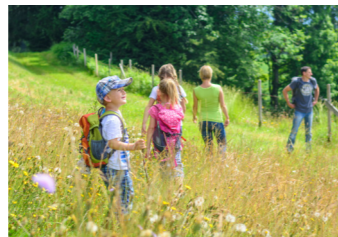
LA CAMPAGNE BOURBONNAISE

À une époque pas si lointaine, Moulins avait sa place parmi les grandes villes de pouvoir de France. L'histoire de la ville est étroitement liée à celle des ducs de Bourbon, puisqu'elle était la capitale du duché et de ses importantes dépendances dès 1376.