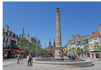
LA PLACE D'ALLIER ET LE CENTRE-VILLE

L'offre commerciale moulinoise est d'une grande qualité et diversité. Restaurants, bars, thé, épices, fromages, chaussures, bijoux, optiques, prêt-à-porter femmes, hommes, enfants, jouets, librairies, décoration... Il y en a pour tous les goûts et toutes les bourses.