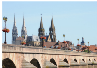
MOULINS, CAPITALE DES BOURBONS

L'offre commerciale moulinoise est d'une grande qualité et diversité. Restaurants, bars, thé, épices, fromages, chaussures, bijoux, optiques, prêt-à-porter femmes, hommes, enfants, jouets, librairies, décoration... Il y en a pour tous les goûts et toutes les bourses.