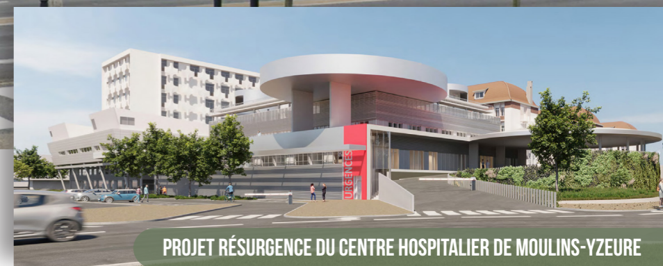
PROJET RÉSORGENCE DU CENTRE HOSPITALIER DE MOULINS-YZEURE

LE CENTRE DE SANTÉ - PROJET SANTÉ VILLES HÔPITAL - VOUS ATTENDS !