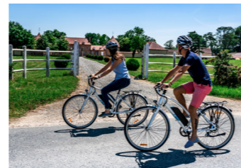
MOULINS, TERRITOIRE SPORTIF

Moulins et son agglomération bénéficient d'un patrimoine naturel idéal au développement du tourisme vert, un cadre de vie exceptionnel et préservé grâce à sa richesse patrimoniale dense tant sur le plan paysager, naturel, qu'architectural et culturel.